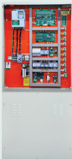
Comando Eletrônico Genius VVVF Infolev

O Comando Eletrônico Genius VVVF funciona como um cérebro que centraliza e controla todas as funções com muito mais eficiência que os antigos comandos eletromecânicos.